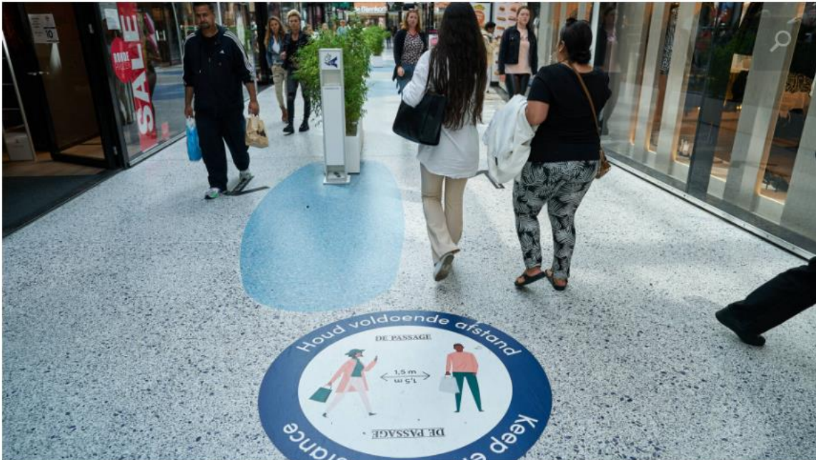
Winkelen in Den Haag